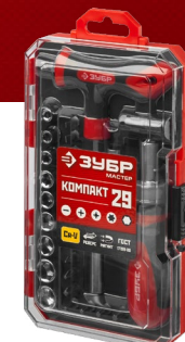
Упаковка: пластиковый бокс