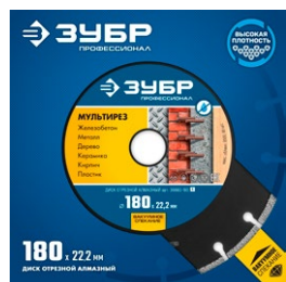
Упаковка: картонный конверт

Применяется для сухой и влажной резки обычного и армированного бетона, кирпича, гранита, мрамора, керамики, металлического профиля, арматуры и других строительных материалов.