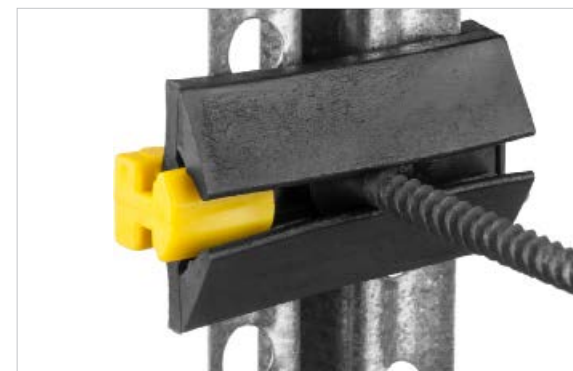
Конструкция в собранном виде