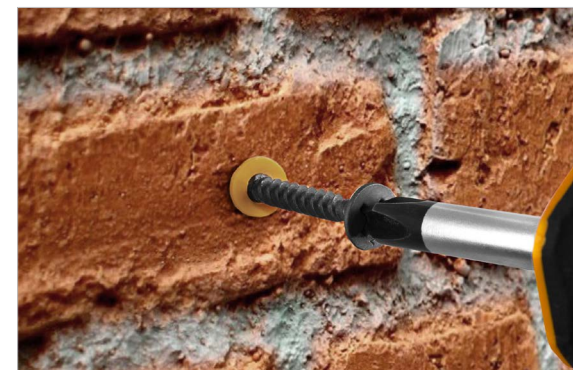
Разметка и вкручивание саморезов перед монтажом профиля