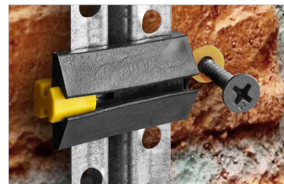
Паз для монтажа зажима на шляпку самореза и регулировки положения профиля