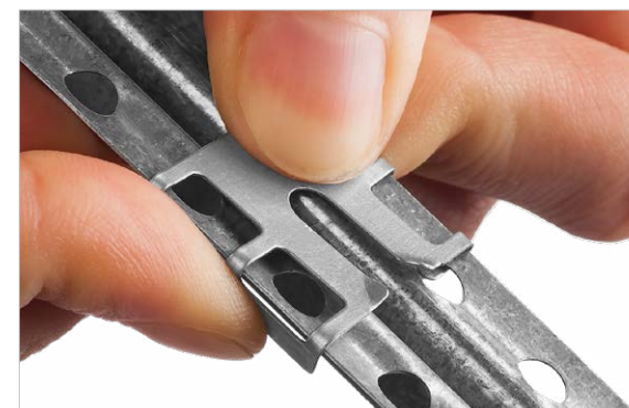
Фиксация зажима на профиле до монтажа на стену