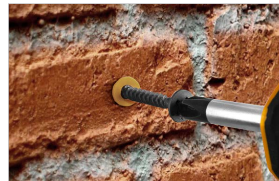
Разметка и вкручивание саморезов перед монтажом профиля