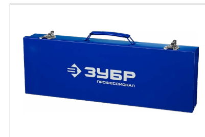
Удобный и надежный металлический кейс