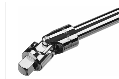
Шарнир для работы под переменным углом