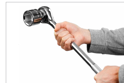
Удлиненная рукоятка для передачи на крепеж необходимого крутящего момента