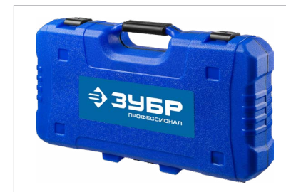
Удобный и надежный пластиковый кейс