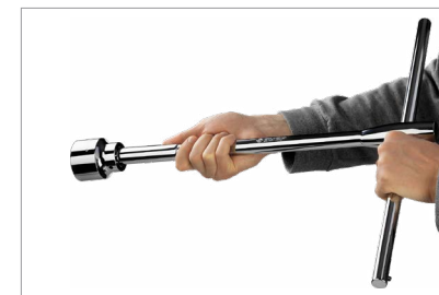
Т-образный вороток с удлинителем для работы в труднодоступных местах