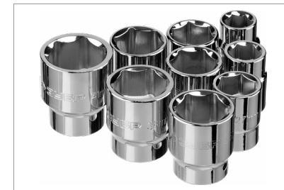
Хромированное покрытие для защиты от коррозии