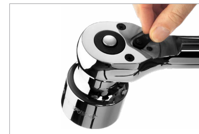
Конструкционная сталь 40X