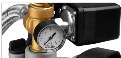
Манометр высокого класса точности позволяет контролировать давление