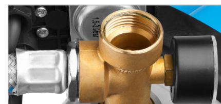
Штуцер с присоединительным диаметром 1"