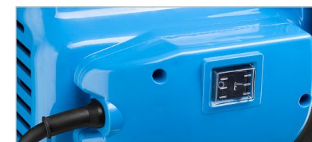
Однофазный двигатель имеет защиту от перегрузки