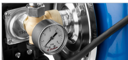
Манометр высокого класса точности обеспечивает контроль давления

Обратный клапан предотвращает вытекание воды в выключенном состоянии