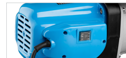
Однофазный двигатель с защитой от перегрузки