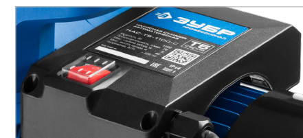
Однофазный двигатель имеет защиту от перегрузки