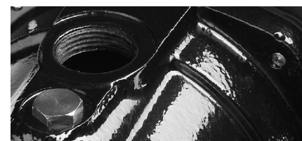
Присоединительный диаметр 1"