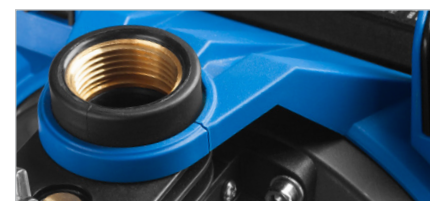
Присоединительный диаметр 1"