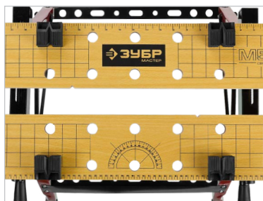
Перфорированные створки длиной 605 мм