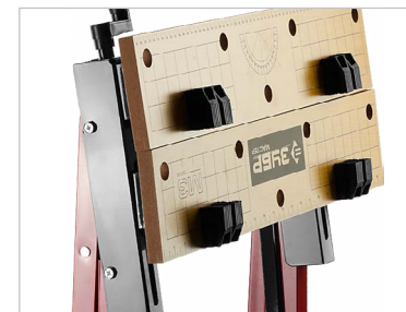
Удобство хранения и переноски в сложенном виде

Применяется в качестве рабочего стола при обработке заготовок различной формы.