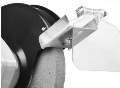
Защитный кожух и прозрачные экраны для безопасности 16-0311 / www.zubr.ru / Тип упаковки: коробка картонная.