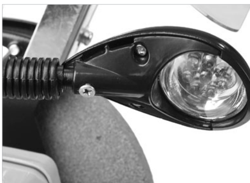
LED лампа подсветки, 8 светодиодов