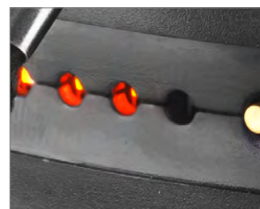
Индикатор заряда батареи