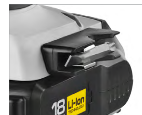
Надежный держатель бит