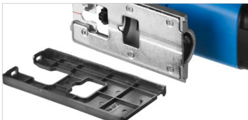
Защитная накладка гарантирует аккуратный рез даже деликатных материалов

Профессиональная конструкция с грибовидной рукояткой для максимальной точности при пилении