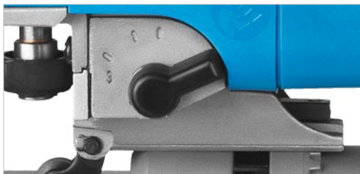
Регулируемый маятниковый ход для быстрого или чистого пиления