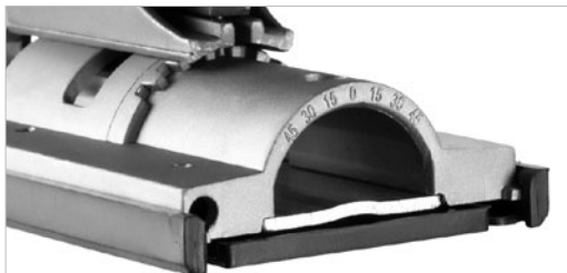
Специальная шкала для точной установки положения подошвы под углом наклона от -45° до +45° с шагом 15°